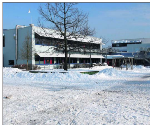
Das Schulzentrum Stift ist nicht nur im Kieler Norden beliebt, sondern inzwischen sogar in Gettorf. Das schafft Probleme.