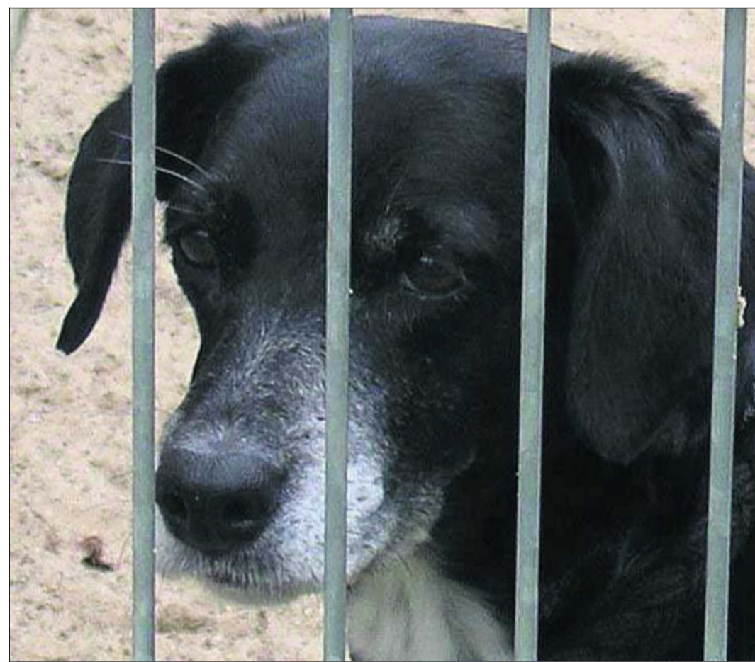
Trauriger Hundeblick von Rüde Benny, der sich eine nette Familie mit viel Platz zum Toben und Spielen wünscht.

Von Sarah Ahadi und Svenja Fehrmann, Klasse 10b, Ernst-Barlach-Gymnasium