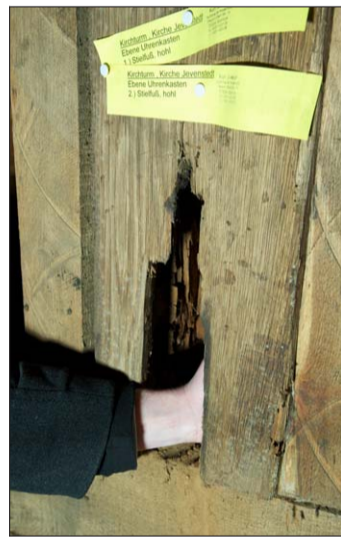
Das Gebälk ist an vielen Stellen stark beschädigt.