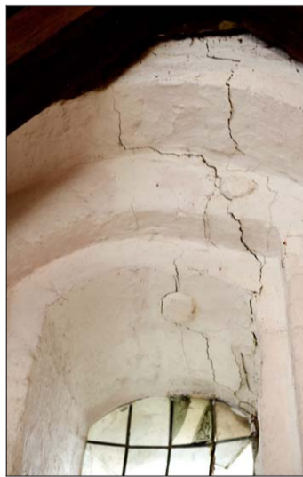
Das Mauerwerk ist auch in Mitleidenschaft gezogen.