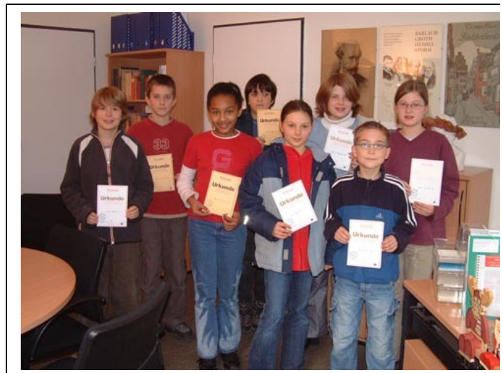
Die Klassensieger des Vorlesewettbewerbs in den 6. Klassen:

Die Fachschaft Wirtschaft/Politik hat im zweiten Schulhalbjahr damit begonnen, einzelne Arbeitsgemeinschaftstage zu Themen aus dem Bereich Wirtschaft und Politik für Schülerinnen und Schüler der Obertertiern und Untersekunden anzubieten. Zweimal haben bereits entsprechende Nachmittage stattgefunden. Die Zahl der freiwilligen Teilnehmer schwankte zwischen 15 und 25, ein ausgesprochen erfreuliches Ergebnis. Es ist denkbar, dass dieses Modell einer einmaligen Arbeitsgemeinschaft in einem rotierenden Verfahren zu bestimmten Themenbereichen fortgesetzt wird.