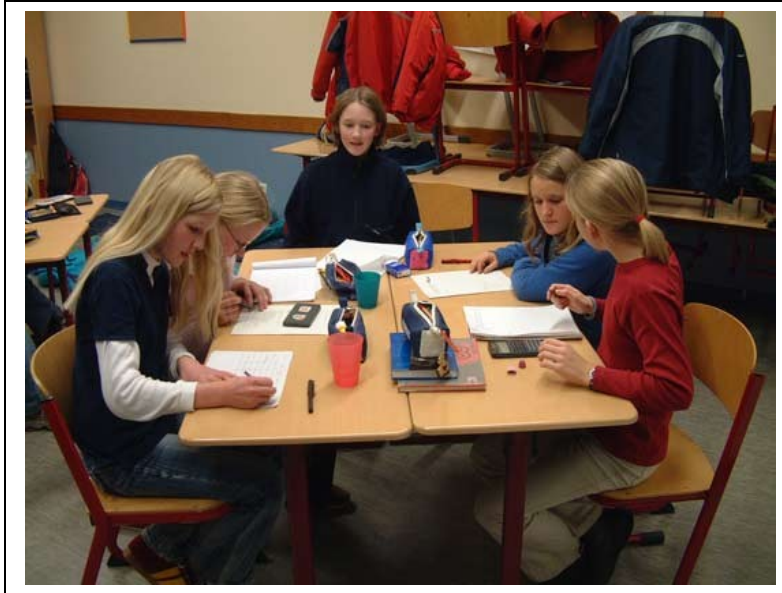
Die lange Nacht der Mathematik am 19.11.2004